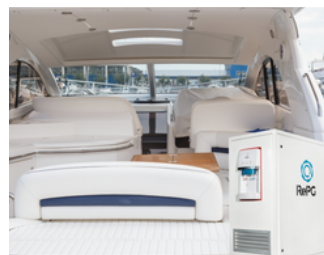
Yat, Yelkenli ve Gemiler