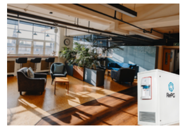
Bekleme Alanları, Oteller