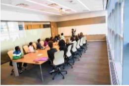
Ofis, İş Yeri, Fabrika