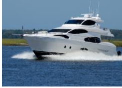
Yat, Yelkenli, Tekne